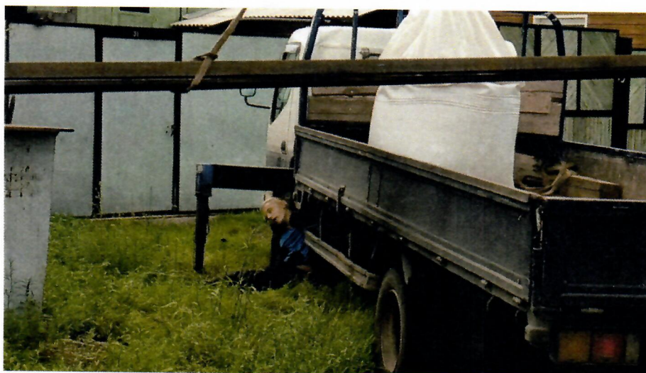
Место НС (пострадавший)