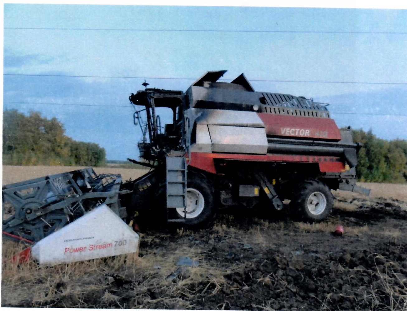
Комбайн с выгоревшей кабиной

Измеренные габариты комбайна: 4,5м – высота комбайна, ~1,5м – оставшаяся длина антенны. Таким образом, общая высота комбайна с антенной составляет ~6,0м и значительно превышает установленные нормативы габаритов для транспортных средств.