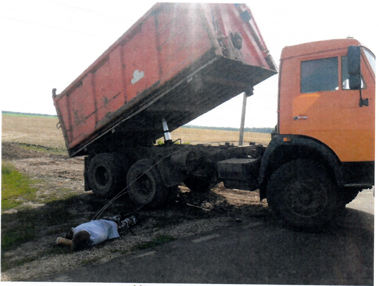
Место несчастного случая