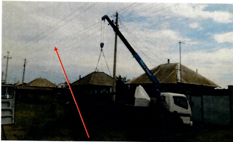
ВЛ 10 кВ ф. 20-34 пролет опор № 41-42

Прибывшая бригада скорой медицинской помощи констатировала смерть пострадавшего.