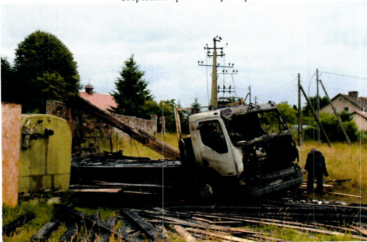
Место несчастного случая