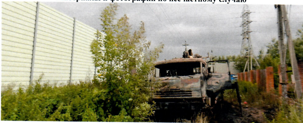
Место несчастного случая.