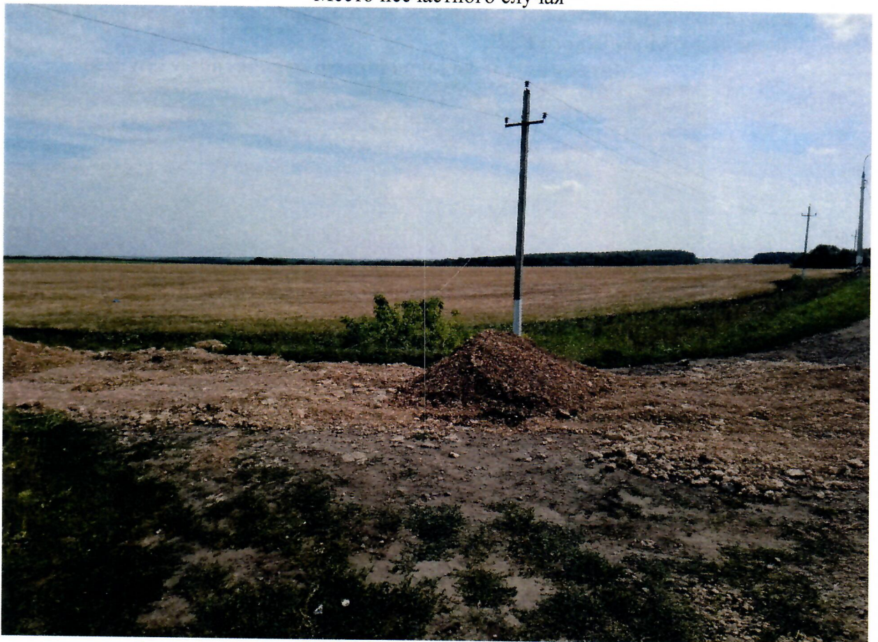
Филиал ПАО «МОЭСК» «Западные электрические сети»