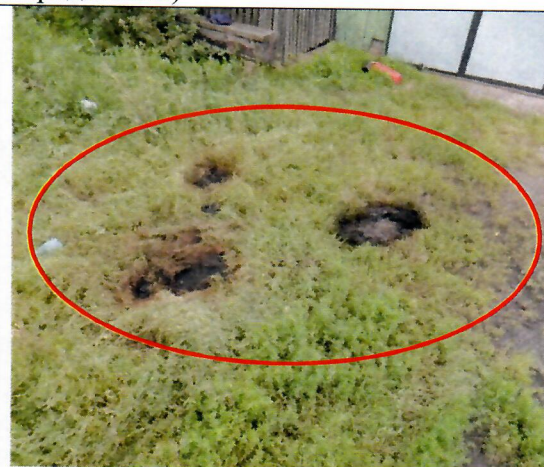
Место НС (следы КЗ на проводе ВЛ и на месте установки крана – манипулятора)