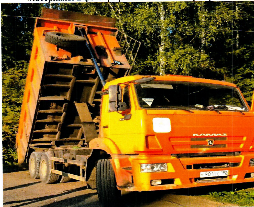
Место несчастного случая