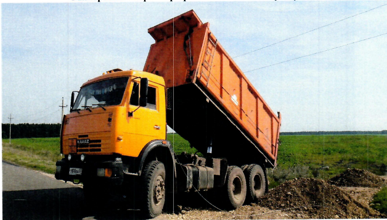
Место несчастного случая