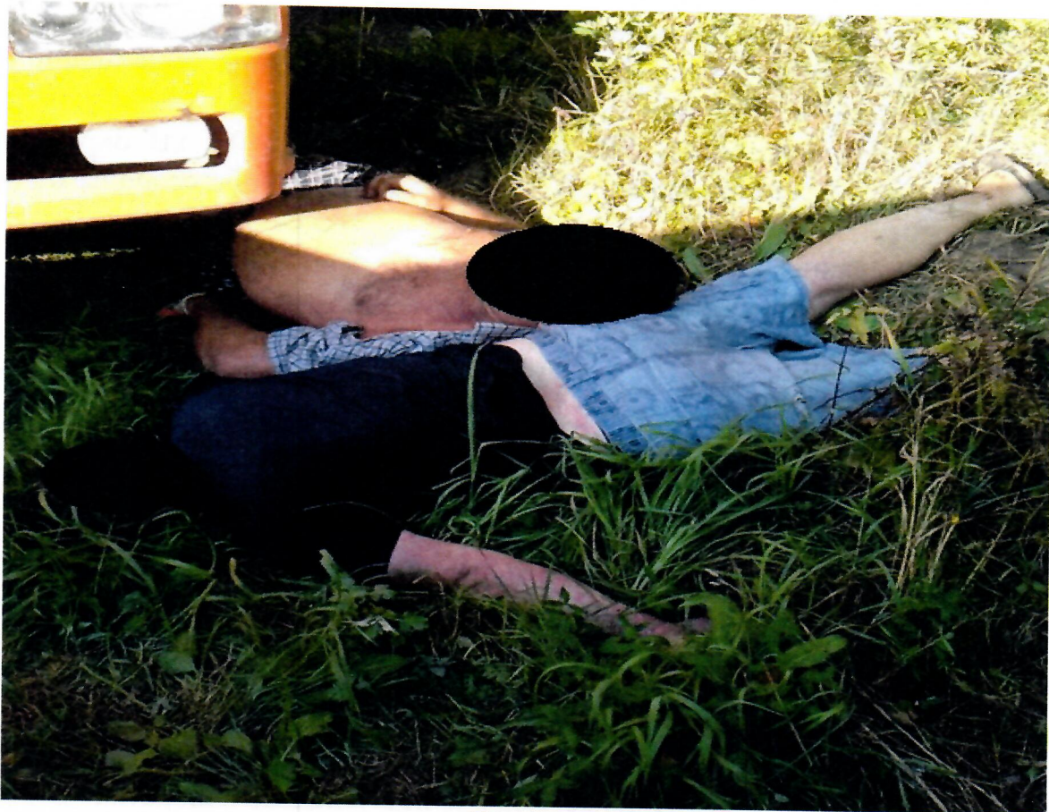
Пострадавшие Термические ожоги ноги пострадавшего