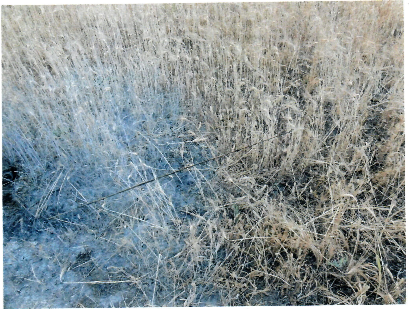
Антенна комбайна, которая стала причиной короткого замыкания